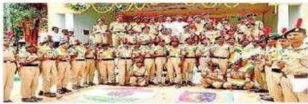
ఎన్సీసీ విద్యార్థుల బృందం

పుంగనూరు గ్రామీణ, స్టూడియో : ప్రముఖ శిక్షణకు మారుపేరు ఎన్సీసీ. పాత కాల స్థాయి నుంచే ప్రముఖ శిక్షణలో భాగించిన విద్యార్థులకు చాలా ఉత్తమ పాఠాలను పేర్కొన్నప్పుడు దీనికి ఎన్సీసీ ఎంతో దోహదపడుతుంది. పుంగనూరు శుభారం ప్రభుత్వ డిగ్రీ కళాశాలలో ఎన్సీసీ 1998లో ప్రారంభించారు. ప్రస్తుతం 104 మంది విద్యార్థులు ఎన్సీసీ కోర్సులో చేరి నేడు 'బి' ప్రవేశత్రాస్తి 99 శాతం మంది విద్యార్థులు సాధించారు. తరువాతి ఏడాది తదితర పట్టణాల్లో సైనిక శిక్షణ కలిగించి ఏజీసీ, సీఎజీసీ క్యాంపుల్లో